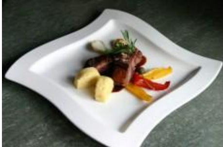
Entspannen in Osttirol