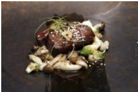
Silvester und spanischer Sonne