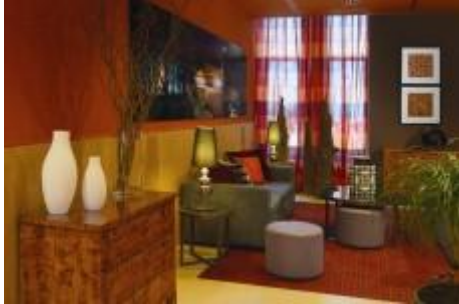
Feiern am Brandenburger Tor