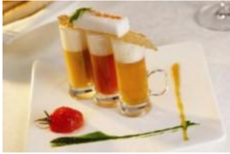
Silvester in bayerischer Berglandschaft