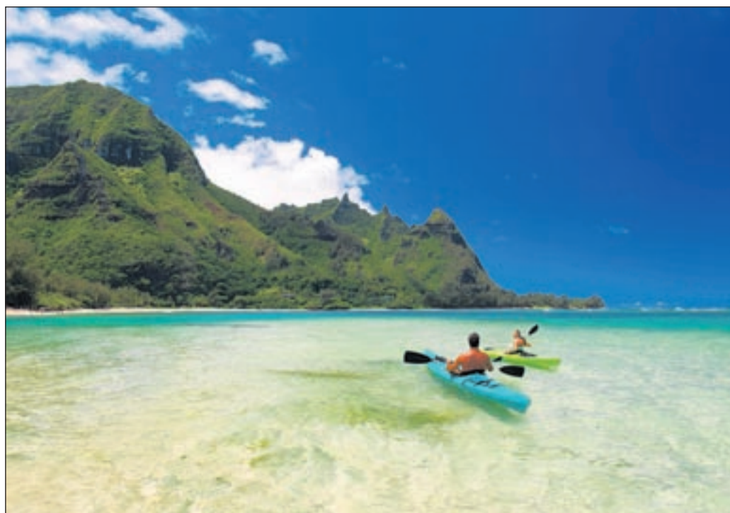
Hawaii ganz entspannt: Paddler an Küste, im Hintergrund der Berg Makana. Die üblichen Mega-Resorts sucht man hier vergebens.

Wer Abwechslung zum Strandleben sucht, der findet im dichter besiedelten Abschnitt zwischen Lihue und Kapaa Museen, Kinos, Golfplätze und relativ ansehnliche Shopping Center. Im ohnehin nicht billigen Hawaii haben sie allerdings ihren Preis. Es ist schon eine Herausforderung, in der Hauptsaison zwischen Dezember und März, der schönsten Jahreszeit auf Hawaii, günstigere Angebote zu finden. Aber auch hier sticht Kauai die anderen Inseln aus. Etwas einfacher wird es mit den Schnäppchen von März bis Juni, wenn viele Studenten vom Festland herüberjetten.