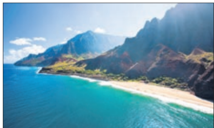
Wild und einsam – die Na Pali Küste der Insel

Beeindruckend sind auch zwei andere Attraktionen Kauais: Vom Hanalei Aussichtspunkt bietet sich ein unvergesslicher Rundblick über das gleichnamige Tal im Norden der Insel. Und nur wenige Kilometer davon entfernt trotz seit 1913 der Kilauea-Leuchtturm auf seinem hohen Felsen den heranrollenden Riesenwellen des Pazifiks.