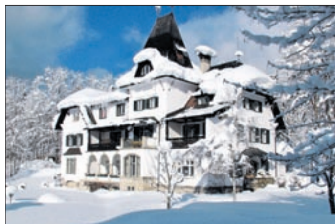
Winterliches Juwel – das Landhaus Koller

Zu Gast sein auf dem fürstlichen Ansitz von Christian Graf zu Stolberg-Stolberg ist im Jagdschloss Kühtai/Tirol www.jagdschloss.at ein höchst aristokratisches Vergnügen. Genau genommen 2.020 Meter hoch, denn hier im Sellraintal liegt das nostalgische Schlösschen, dessen Geschichte bis ins Jahr 1280 zurückgeht. Gewohnt wird im Haus des Ur-Ur-Enkels von Kaiser Franz-Joseph I. in zirbenvertäfelten Grafen- und Fürstenzimmern, im modernen Elisabethflügel oder gar im originellen Appartement „Schweinestall“.