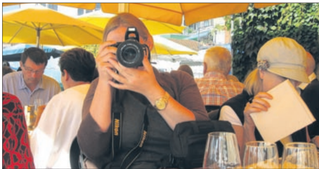
Vorsicht Foto: Schnappschüsse und ihre Veröffentlichung können teuer werden.

Bei Urlaubsfotos die Rechte von anderen Reisenden beachten