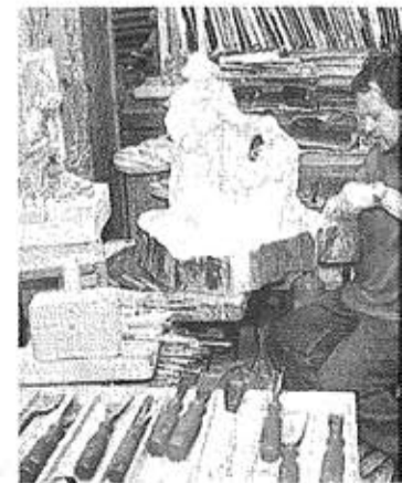
Besuch in Osttirol: Kirchlein bei Kals (oben), Schloss Bruck(links) und bei Schnitzplaner (rechts).