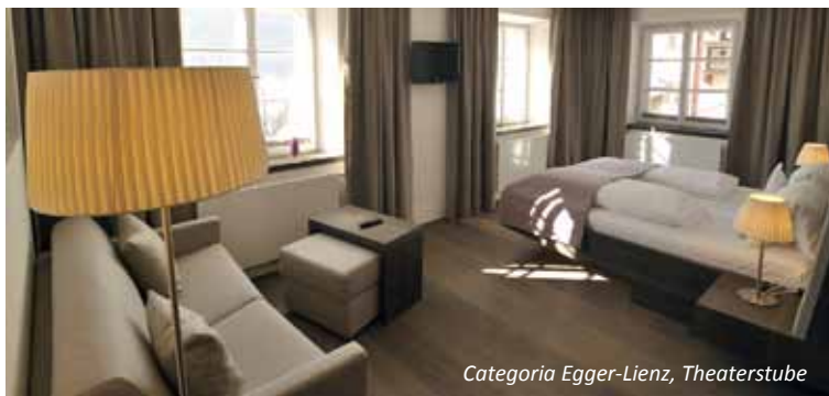
Categoria Egger-Lienz, Theaterstube

Tutti gli arredi sono di legno non trattato e stoffe di loden.